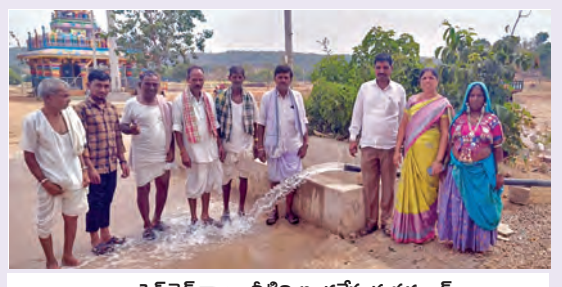
వైసీపీ ద్వారా నీటిని అందజేస్తున్న సర్వం