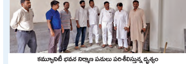
కమ్మూనిటీ భవన నిర్మాణ పనులు పరిశీలిస్తున్న దృశ్యం